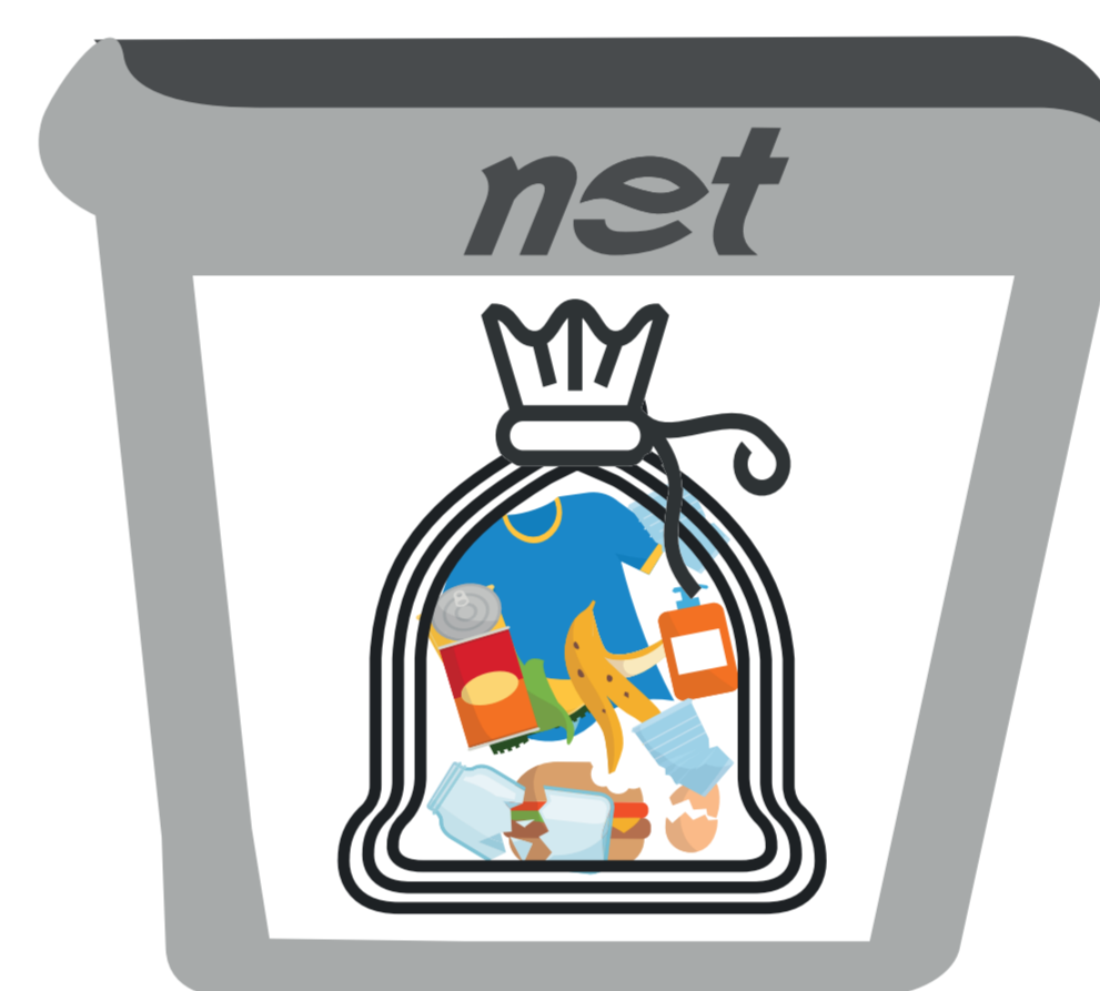
SECCO RESIDUO (INDIFFERENZIATO)

I FAZZOLETTI, LA CARTA ASSORBENTE DA CUCINA, LE MASCHERINE, I GUANTI E I TELI MONOUSO DEVONO ESSERE RACCOLTI NEL SACCHETTO UTILIZZATO PER I RIFIUTI INDIFFERENZIATI (RIFIUTO SECCO RESIDUO).